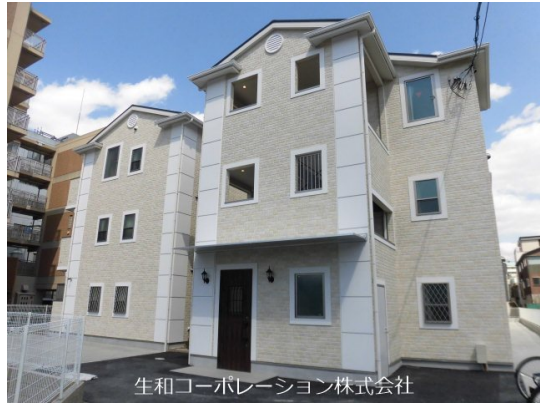
生和コーポレーション株式会社